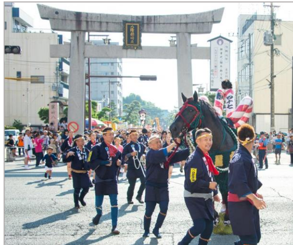
<過去の「藤崎八幡宮例大祭」の様子>